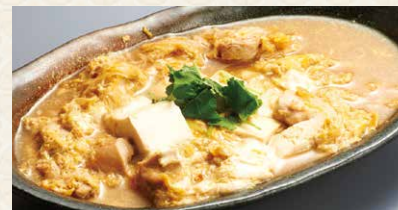
地養鳥の玉子とじ