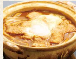
みそ煮込みうどん